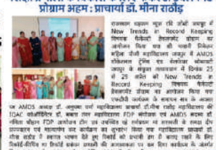
विषयक फैकल्टी के सदस्यों ने शिक्षा प्रणाली के विकास के लिए फैकल्टी डेवलपमेंट प्रोग्राम में भाग लिया।