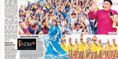
छात्र संघ के सदस्यों ने नवरात्रों के अवसर पर एक कार्यक्रम में सांस्कृतिक प्रदर्शन किया।

स्विजल पक्ष में नवरात्रों के बीच युवाओं ने सिंगिंग और डांस से दिया संस्कृति का संदेश भारत में भौगोलिक चमत्कार, विविध संस्कृतियों, ऐतिहासिक धरोहरों और वैश्विक आश्चर्यों के बारे में दिखाया गजब का ज्ञान