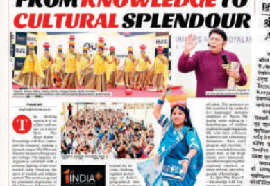
छात्रों ने विषयक फैकल्टी डेवलपमेंट प्रोग्राम में भाग लिया।