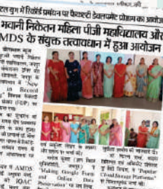
विषयक फैकल्टी के सदस्यों ने विषयक पांच दिवसीय फैकल्टी विकास कार्यक्रम में भाग लिया।