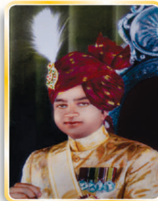
Our Honourable Founder Lt. Gen. Maharajadhiraj Sir, Sawai Mansingh Ji Bhadur II G.C.I.E. Maharaja, Jaipur

Educate a Girl and you Educate the Community