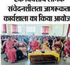
विषयक फैकल्टी के सदस्यों ने लैंगिक संवेदनशीलता जागरूकता कार्यशाला में भाग लिया।